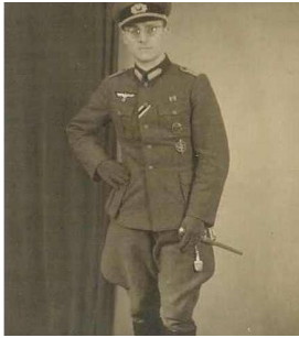
Mein Vater als junger Mann